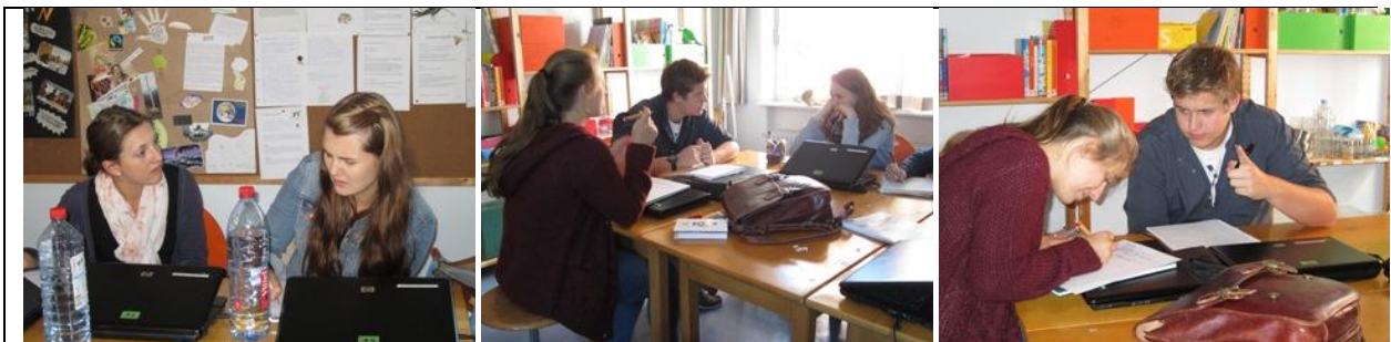
Individuelles Arbeiten an den Entdeckertagebüchern