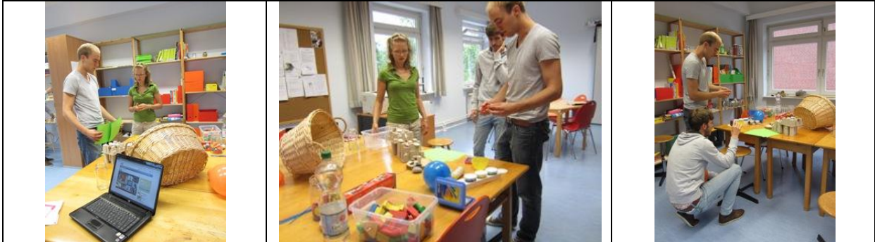
Kulissenbau und Aufnahmen für den Knetfigurenfilm